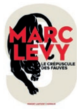
9 T.02 Le crépuscule des fauves Marc Levy