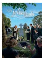
Les jolis deuils T.3: Horizons bleus Marjolaine Bouchard