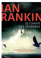
Le chant des ténèbres Ian Rankin