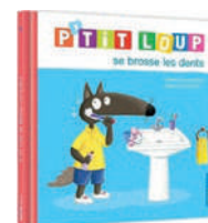
P'tit Loup se brosse les dents Orianne Lallemand et Éléonore Thuillier