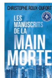
Les manuscrits de la main morte Christophe Roux-Dufort