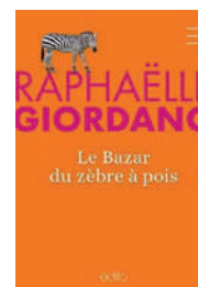
Le bazar du zèbre à pois Raphaëlle Giordano