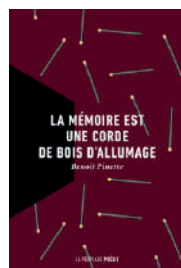
La mémoire est une corde de bois d'allumage Benoit Pinette